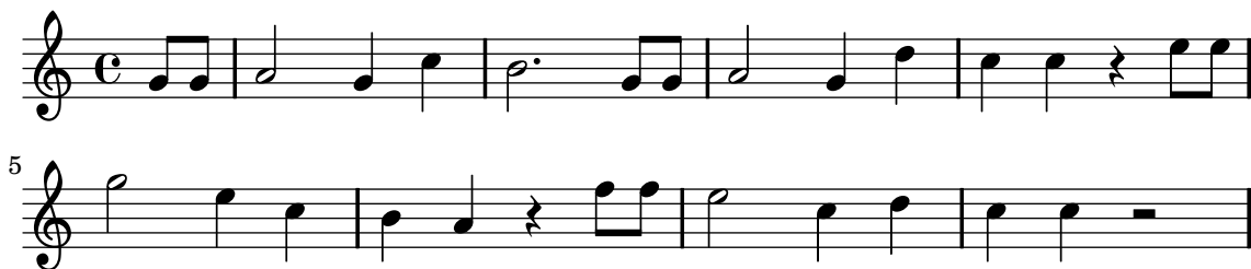
Figura 1. Melodia de Parabéns a Você .

b Note que as condições para uma sétima ser considerada significativa são diferentes em cada função.